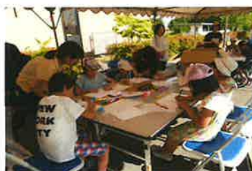
岡大ほたる祭り(H29.5月)