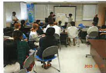
フォーラム第33回(R5.5月)

■ 他の団体が行うイベントなどに参加し、支援協力による活動の多角化と情報交流に努めています。