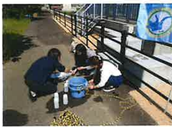
身近な水環境の全国一斉調査 (H29.6月)