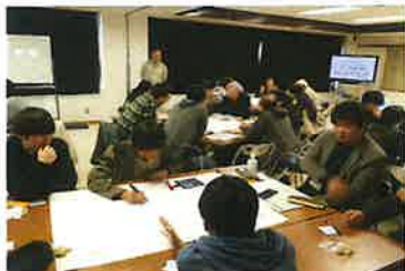
フォーラム第24回(H27.12月)

■ 主体活動としての フォーラムを計33回実施 。児島湖にまつわる時々のテーマをもとに、ワークショップにより各世代の参加者が自由に議論し、環境保全に向けた意識醸成に努めています。