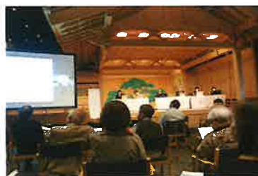
日本雑草学会シンポジウム (R3.12月)

R4.11月の児島湖流域清掃大作戦のあと、参加者に無料で舞われた児島湖産の「テナガエビ」の唐揚げ。