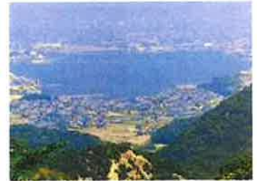
金甲山より児島湖を望む