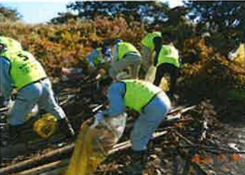
児島湖流域清掃大作戦(R4.11月)