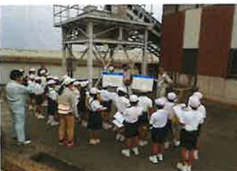
七区小学校出前授業(H27.10月)