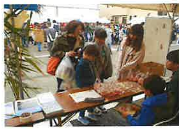
藤田ふれあい祭り(R1.11月)