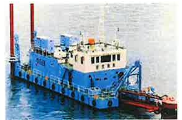
児島湖に浮かぶ底泥浚渫船