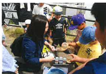
身近な水環境の全国一斉調査 (H27.6月)

■ 他の団体が行うイベントなどに参加し、支援協力による活動の多角化と情報交流に努めています。