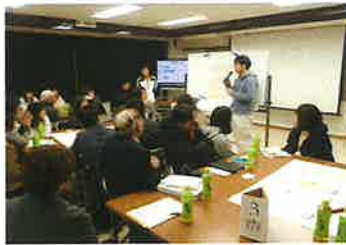
フォーラム第28回(H29.12月)