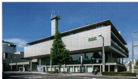
RSKイノベティブ・メディアセンター 所在地：岡山市北区天神町9-24