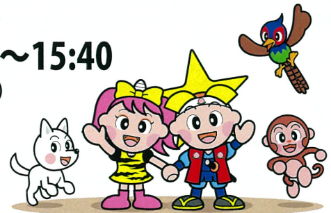
岡山県マスコット「ももっち」「うらっち」

定員 100名 (事前申し込みで先着順。定員になり次第締め切りますが、席に余裕がある場合は当日参加も可能です。)